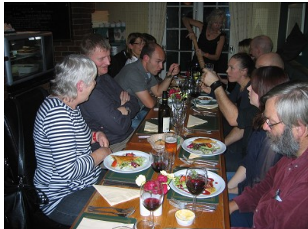
Mikilvægur svona verkefna er að kynnast og ræða málin.