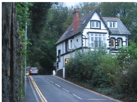
Glen View Guesthouse.

Swansea flói. Swansea er um það bil eina klukkustund frá Cardiff sem er stærsta borg Wales. Swansea er næst stærst með um 100.000 íbúa.