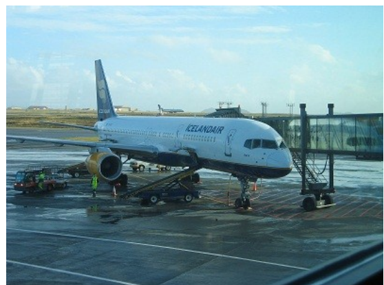
Icelandair þota sem fór til London

Flugið gekk vel. Fórum í loftið um kl. 16.30 í stað 16.10 og lentum í London eftir smá hringsól vegna umferðar um kl. 19 eða um kl. 20 að staðartíma.