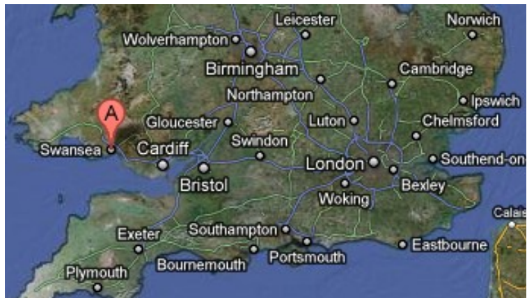
Syðsti hluti Bretlands. Fundurinn í Swansea í Wales.

Föstudagur 7. október 2011. Jóhannes fór til Reykjavíkur vegna persónulegra erinda um kl. 14 en fluginu seinkaði dálítið. Lentur í Reykjavík um kl. 15.