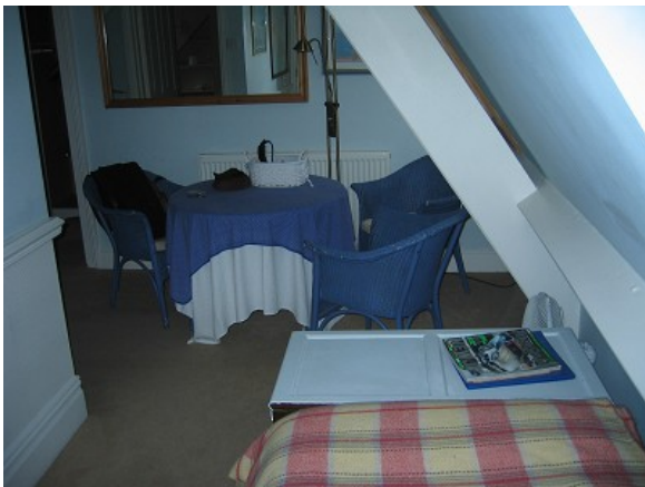
Setustofan í risinu.

Glen View Guesthouse er virðulegt stórt hús, hefur verið stórt einbýlishús en nú eru 6 – 8 herbergi í því.